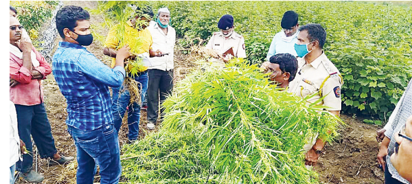
उस्मानाबाद जिल्ह्यातील विजोरा येथे शेतात आंब्याच्या ओळीत लागवड केलेली गांजाची झाडे जप्त करताना पोलीस व महसूल विभागाचे पथक.